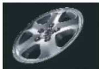
18-palčna kolesa s pnevmatikami dimenzije 255/60