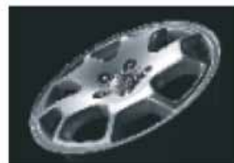
16-palčna kolesa s pnevmatikami dimenzije 235/75 ali 255/70